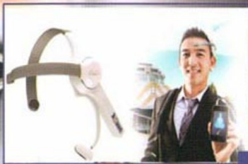
wave محصول جدید iPhone